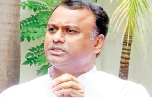
కొన్ని రోజులు మాత్రమే నడుస్తాయని.. ఆ తర్వాత జనాలెవరూ మీ మాట నమ్మబోరని చెప్పారు.

మునుగోడు ఉప ఎన్నికలో నేతల మధ్య మాటల తూటాలు పేలుతున్నాయి. ముఖ్యమంత్రి కేసీఆర్ ఏం చేసినా మునుగోడులో గెలిచేది తానే అని బీజేపీ అభ్యర్థి కోమటిరెడ్డి రాజగోపాల్ రెడ్డి ధీమా వ్యక్తం చేశారు. నోవల్ మీడియాలో తనకు వ్యతిరేకంగా తప్పుడు ప్రచారం చేయిస్తున్నారని విమర్శించారు. కేసీఆర్, కేపి పాల్ ఇద్దరూ ఒక్కటేనని చెప్పారు. మునుగోడులో జరుగుతున్నది సాధారణ ఎన్నిక కాదని.. కురుక్షేత్ర యుద్ధమని అన్నారు. ఈ యుద్ధంలో తనతో పాటు ఎంపీ కోమటిరెడ్డి వెంకటరెడ్డి కూడా కలిసిరావాలని చెప్పారు. తన రాజీనామా దెబ్బకు ఫామ్ హౌస్ లో ఉన్న కేసీఆర్ కూడా మునుగోడుకు వస్తున్నాడని కోమటిరెడ్డి అన్నారు. జనాలను బురిడీ కొట్టించి నమ్మించే తెలివితేటలు