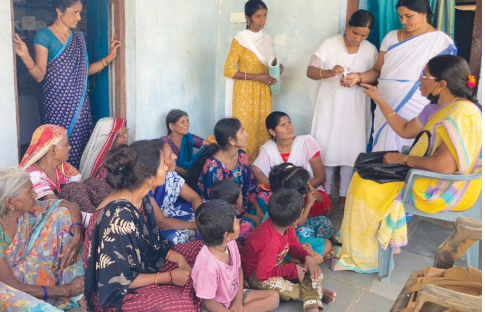
ఉపయోగించాలోకూడా వారికి ట్రినింగ్ ఇచ్చామన్నారు. ఈ కార్యక్రమంలో స్కూల్ హెడ్ మాన్యర్, డీపర్డు ఏఎన్ఎం లు ఆశా కార్యకర్తలు ప్రజలు పాల్గొన్నారు.

జాతీయ అయోడిన్ రుగ్మతల నివారణ దినోత్సవం సందర్భంగా శనివారం డోక్టర్ మండలం చిలుకొడు సబ్ సెంటర్ పరిధిలోని పత్తిరంధా పాఠశాల, అంగన్నాడి సెంటర్లలో మరియు పలు తండాలో ప్రజలకు అయోడిన్ లోపం పల్ల వచ్చే అనారోగ్య సమస్యల పై డోక్టర్ ప్రాథమిక ఆరోగ్య కేంద్రం ఆధ్వర్యంలో హెన్ ఈ కారద, అవగాహన కల్పించారు. అయోడిన్ లోపం పల్ల గొంతువాపు , మరుగుజ్జుతనం, పయసుకు తగ్గ మరుకుదనం తేకపోవడం వంటి లక్షణాలు సంభవిస్తాయిని ప్రతి కుటుంబం అయోడిన్ ఉన్న ఉప్పు నే వాడాలని, ప్రజలకు సూచించారు. ప్రజలు వాడే ఉప్పులో అయోడిన్ లోపం ఉందో లేదో తెలుసుకోవడానికి ఆశలకు ఏఎన్ఎం లకు, ఒక కిట్టు ఇచ్చామని అది ఎలా