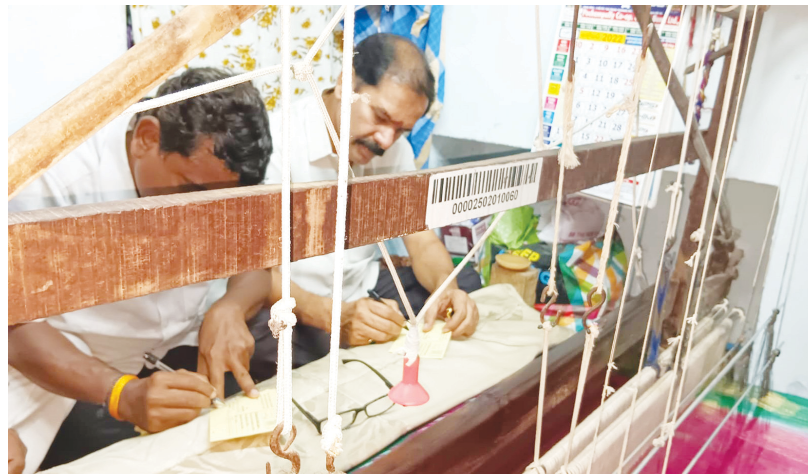
పోస్ట్ కార్డ్ ఉద్యమాన్ని నిర్వహించి చేనేత మరియు జోలి ఉత్పత్తులపై కేంద్రం 5 శాతం జీఎస్ టీ రద్దు చేసే వరకు ఉద్యమిద్దమన్నారు.

చేయడం జరిగిందన్నారు. మళ్ళీ చేస్తామని కూడా కేటీఆర్ ప్రకటించిన విషయాన్ని ఈ సందర్భంగా చీఫ్ విప్ గుర్తు చేశారు. అలాగే ముడి సరుకులపై రాష్ట్ర ప్రభుత్వం 40 శాతం సబ్సిడీని కూడా కల్పించి చేనేతకు చేయూతనిచ్చిన విషయాన్ని ఆయన ప్రస్తావించారు. రాష్ట్ర ప్రభుత్వం నేతనులకు అందగా నిలుస్తుంటే కేంద్ర ప్రభుత్వం జీఎస్ టీని విధించి గుడిబండను మోపుతుందన్నారు. అందుకే మంత్రి కేటీఆర్ పిలుపుమేరకు నేతనుకు అందగా రాష్ట్ర వ్యాప్తంగా