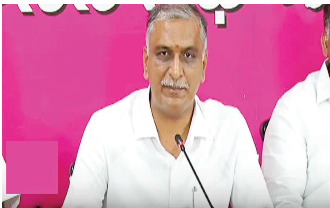
వ్యక్తం చేశారు. బెనారస్ యూనివర్సిటీలో భూత వైద్యంలో హరీష్. బండి సంజయ్ రూ.50వేల ఫీజు కట్టి ఆ కోర్టులో సర్టిఫికేట్ కోర్టు ప్రవేశపెట్టిన ఘనత బీజేపీకి చెల్లించడం చేరతే బాగుంటుందని చురకలంటిచేశారు.

హైదరాబాద్ (సుభ తెలంగాణ): మునుగోడు ఉప ఎన్నికల్లో బీజేపీ డాడ్డిదారిన గెలిచే ప్రయత్నం చేస్తోందని వైద్యారోగ్య శాఖ మంత్రి హరీష్ రావు అన్నారు. ఓట్ల కోసం బీజేపీ డబ్బు పంచడంతో పాటు 2వేల కార్లు, 2వేల బైకులు కొనిచ్చే ప్రయత్నంలో ఉందని ఆరోపించారు. తమ పార్టీ నాయకులకు కొనేందుకు సైతం వారు ప్రయత్నిస్తున్నారని హరీష్ రావు విమర్శించారు. బైకులు, కార్లు ఎక్కడి నుంచి తెస్తున్నారో ఆరా తీస్తున్నామని, వివరాలు అందిన వెంటనే ఎన్నికల సంఘానికి ఫిర్యాదు చేస్తామని చెప్పారు. మోటార్లు ఇస్తామంటున్న బీజేపీ నేతలు తర్వాత బావుల దగ్గర మీటర్లు పెడతారని అందుకే మునుగోడు ప్రజలు ఆలోచించి నిర్ణయం తీసుకోవాలని హరీష్ రావు సూచించారు. ఈ ఉప ఎన్నిక మునుగోడు ప్రజల ఆత్మ గౌరవానికి పరీక్ష అని అన్నారు. టీఆర్ఎస్ ప్రభుత్వం అనేక సంక్షేమ పథకాలు అమలు చేస్తుండగా.. బీజేపీ చెప్పుకునేందుకు ఒక్క స్ట్రా కూడా లేదని అన్నారు. డీజిల్, గ్యాస్ ధరలు పెంచడం, ప్రభుత్వ సంస్థల్ని అమ్మి దేశం ఆగం చేయడం తప్ప బీజేపీ చేసిందేదీదని హరీష్ రావు విమర్శించారు. అగ్నిపథ్ స్కీమ్తో సైనికుల ఉసురు పోసుకుంటోందని మండిపడ్డారు. మునుగోడులో గెలిచేది రాజగోపాల్ ధనమా లేక ప్రజాస్వామ్యపూరిత అని హరీష్ ప్రశ్నించారు. టీఆర్ఎస్ ను ఎదుర్కోలేక క్షుద్రపూజలు, మంత్రతంత్రాల పేరుతో విష ప్రచారం చేస్తున్నారని ఆగ్రహం