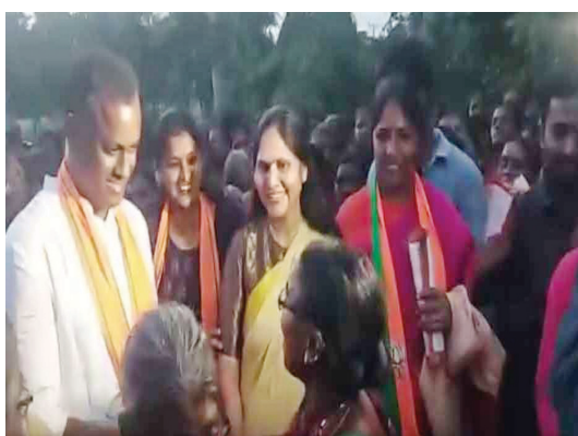
మండిపడ్డారు. వివరాలు 2లో..