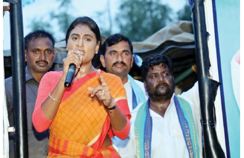
శిక్షించాలని ప్రభుత్వాన్ని డిమాండ్ చేశారు. ఈ చర్యలకు పాల్పడిన వారు ఎవరైనా సరే వదిలిపెట్టడం లేదని హెచ్చరించారు.

ఖమ్మం జిల్లా కూసుమంచి మండలంలో వైఎస్సార్ విగ్రహాన్ని కూల్చివేసారని వైఎస్సార్ తెలంగాణ పార్టీ అధ్యక్షురాలు పర్చిల ఆగ్రహం వ్యక్తం చేశారు. వైఎస్సార్ విగ్రహాలను కూల్చిన పిరికిపందర్లారా ఖబడ్డారంటూ హెచ్చరించారు. ప్రజల్లో ముఖం చెల్లెల, ప్రజలు మిమ్మల్ని చీదరించుకుంటున్నారన్న ఆసహనంతో వైఎస్సార్ విగ్రహాలను కూల్చుతున్నారా? అంటూ నిలదీశారు. వైఎస్సార్ తెలంగాణ పార్టీకి వస్తున్న ఆదరణను తట్టుకోలేక, మా ప్రశ్నలకు సమాధానాలు చెప్పలేని దౌర్భాగ్యుల్లారా అంటూ మండిపడ్డారు. మాతో చర్చించే దమ్ములేని దుర్జనులారా... విగ్రహాలను కూల్చినంత మాత్రాన జనం గుండెల్లో కొలువైన వైఎస్సార్ స్థానాన్ని ఎవరూ కూల్చలేరని పర్చిల స్పష్టం చేశారు. ఖమ్మం జిల్లాలో వైఎస్సార్ విగ్రహాన్ని కూల్చివేసిన వెధవలను వెంటనే అరెస్ట్ చేసి చట్టప్రకారం