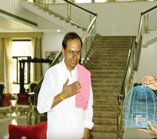
తెలంగాణ ముఖ్యమంత్రి కేసీఆర్ వివాదంలో చిక్కుకున్నారు. దసరా పర్వదినాన పాలపిట్టను చూస్తే ఉల్లంఘించిన వారు శిక్షార్హులు అవుతారు.

మంచి జరుగుతుందనే నమ్మకం తెలంగాణలో ఉన్న సంగతి తెలిసింది. ఈ నేపథ్యంలో, పండుగ రోజున చూసేందుకు ప్రగతి భవన్ కు పాలపిట్టను ముఖ్యమంత్రి తెప్పించుకున్నారు. సీఎం కోసం అధికారులు పాలపిట్టను పంజరంలో బంధించి తీసుకొచ్చారు. ఇప్పుడు దీనిపైనే విమర్శలు వెల్లువెత్తుతున్నాయి. ఈ ఘటనపై జంతు ప్రేమికులు ఆగ్రహం వ్యక్తం చేశారు. ప్రైవేట్ ప్రాబ్లిక్స్ యాక్ట్ 1972 ప్రకారం పాలపిట్టను బంధించడం నేరం. ఈ చట్టాన్ని ఉల్లంఘించిన వారు శిక్షార్హులు అవుతారు.