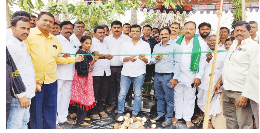
సూర్యాపేట జిల్లా మద్దిరాల మండలం పొలుమట్ల గ్రామంలో పిఎస్సెస్ ఆధ్వర్యంలో ధాన్యం కొనుగోలు సమితి రైతులు మొసపోవద్దు అని అన్నారు. రైతులు