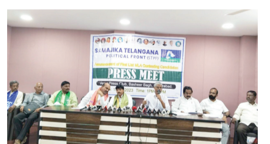
బీ ఎమ్ పీ, నాయకులు,బీసీ, ఎస్సీ, ఎస్టీ కుల సంఘాల నాయకులు తదితరులు పాల్గొన్నారు.