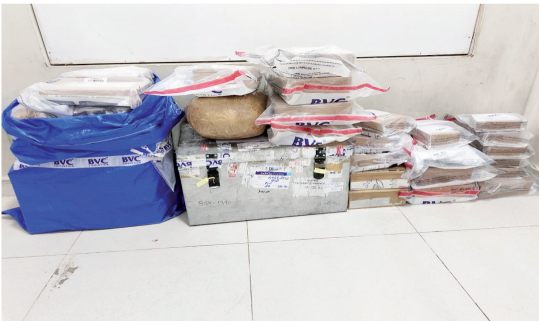
రవాణా ఏజెన్సీ సేకరించిన బంగారం %డి-సా% వెండి ఆభరణాలు ముంబై, చెన్నై, బెంగళూరు మరియు కేరళకు రవాణా చేయబడతాయి. స్వాధీనం చేసుకున్న సొత్తు, బిల్లుల వెరిఫికేషన్ కోసం ఆదాయపు పన్ను శాఖకు అప్పగించారు. స్టేషన్ హౌస్ ఆఫీసర్ చందానగర్ పిఎస్ సైబరాబాద్.

రంగారెడ్డి జిల్లా అక్టోబర్ 17, (సుభ తెలంగాణ ) ప్రతివాదుల పేరు: 1. కళ్యాణ్ జ్యువెలర్స్ 2. మలబార్ గోల్డ్ %డి-సా% డైమండ్స్ జ్యువెలర్స్ 3. లలిత జ్యువెలర్స్ 4. రిలయన్స్ రిటైల్ ప్రైవేట్. లిమిటెడ్ 5. వివాజ్ జ్యువెలర్స్ స్వాధీనం చేసుకున్న వస్తువులు: 1. బంగారు ఆభరణాలు-28.9 కేజీలు 2. వెండి ఆభరణాలు-25.7 కేజీలు సంక్షిప్త చరిత్ర:- సరైన బిల్లులు లేకుండా బంగారం రవాణా చేస్తున్నారనే విశ్వసనీయ సమాచారం మేరకు 16.10.2023న సుమారు 2300 గంటల సమయంలో చందానగర్ పోలీసులు ఎస్ ఓ టి మాదాపూర్ బృందంతో కలిసి చందానగర్ మెయిన్ రోడ్డులో మహిళా లోకం ఎదురుగా ఉన్న గంగారాం, చందానగర్ వద్ద వాహన తనిఖీలు నిర్వహించగా, ఒక వాహనం నం. బి.వి.సి లాజిస్టిక్స్ రవాణా యొక్క టీఎస్ 08 యు జి 8033. బంగారు ఆభరణాలు-28.9 కేజీలు మరియు వెండి ఆభరణాలు-25.7 కేజీలు పైన ఉన్న నగల వ్యాపారాలకు చెందిన సీల్డ్ బాక్స్ లో ఉంటాయి. రవాణా వాహన సిబ్బందితో తనిఖీ చేయగా వారికి సరైన బిల్లులు లేవు. హైదరాబాద్ లోని పైన పేర్కొన్న నగల దుకాణాల్లో