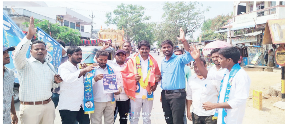
వలిగొండ శుభ తెలంగాణ : ధర్మసమాజ్ పార్టీ భువనగిరి నియోజకవర్గ ఎమ్మెల్యే అభ్యర్థిగా ఆ పార్టీ జిల్లా అధ్యక్షులు