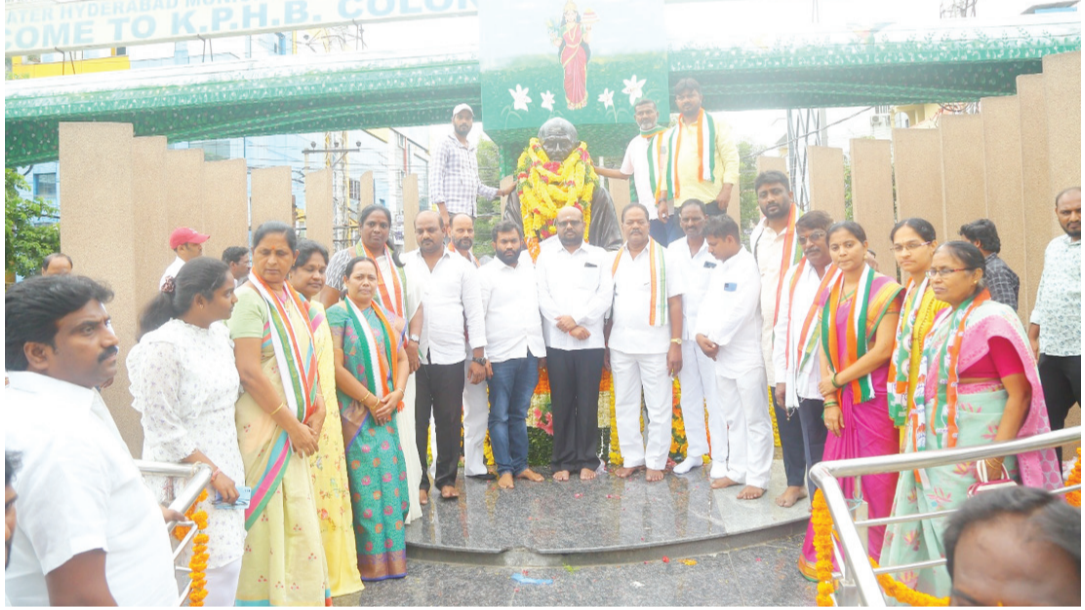
మహాత్మాగాంధీ ఆశయాలను ముందుకు తీసుకెళ్లడమే కాకుండా వారి బాటలో నడవడమే ప్రతి భారతీయుని విధి